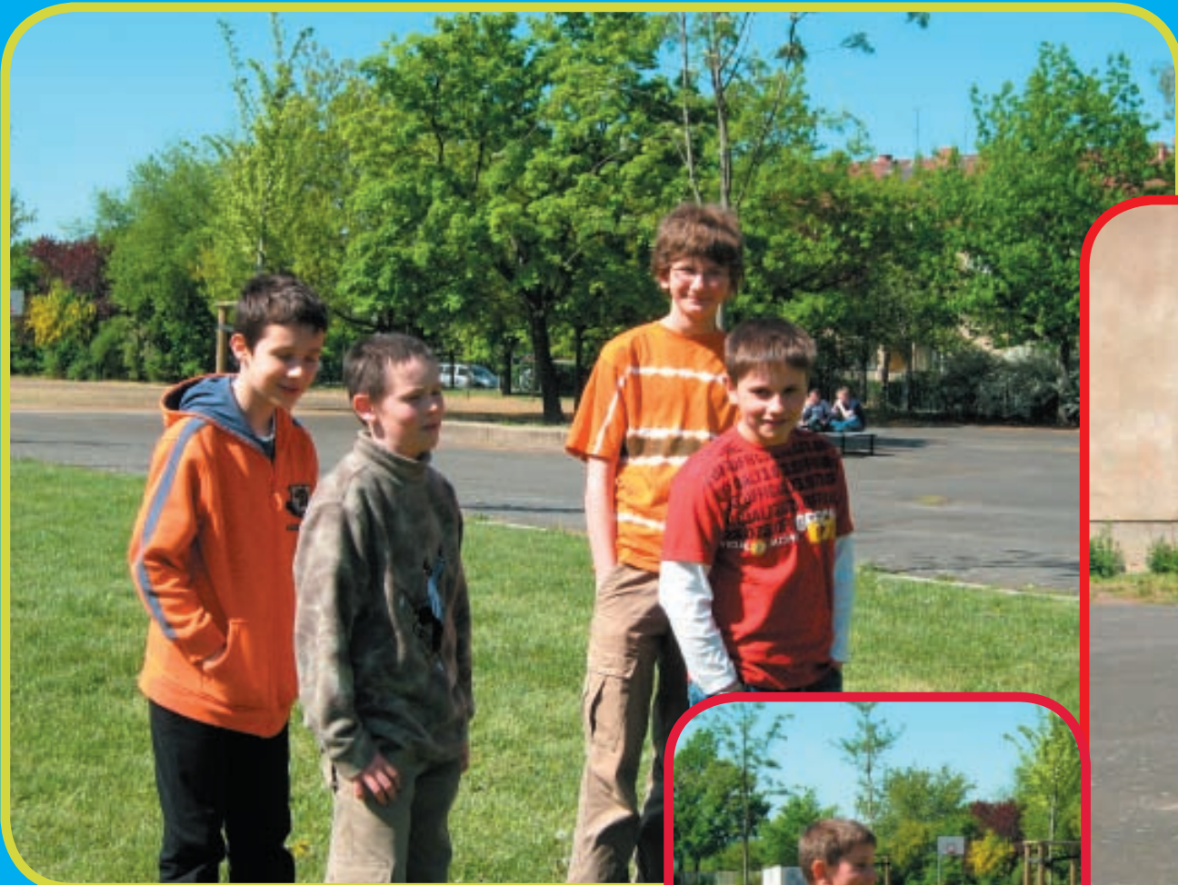
Die Mannschaften sind klar – beinahe.