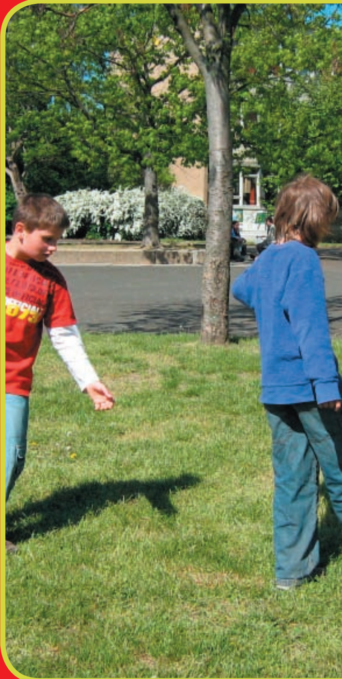
Vladi erobert den Ball und hat alle abgehängt.