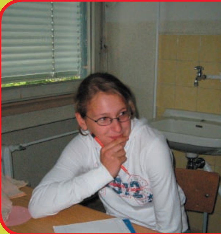
Selbst die Lehrerin schmunzelt.