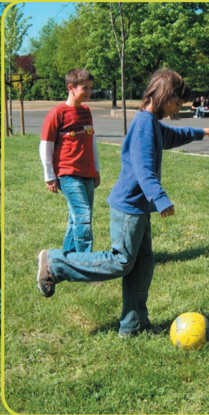
Vladi schießt ...