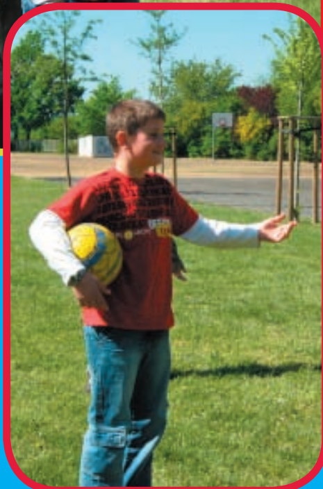
Andy sagt: „Geben wir ihm doch eine Chance!“