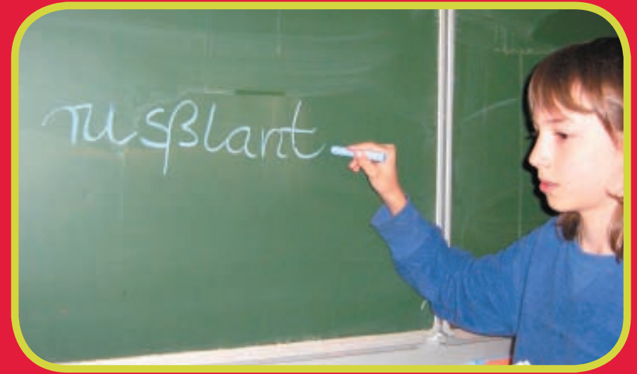
Da macht Vladimir einen „kleinen“ Fehler ...